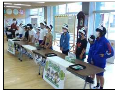
緑の羽根募金 (JRC委員会)