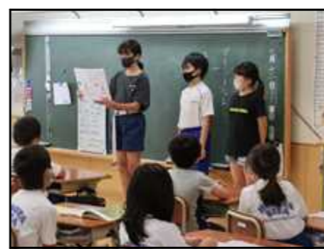
「廊下は歩こう」 (運営委員会)