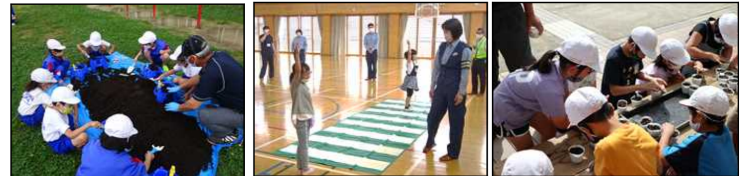
すいかの苗植え (2年生)