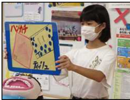
健康タイム (保健委員会)